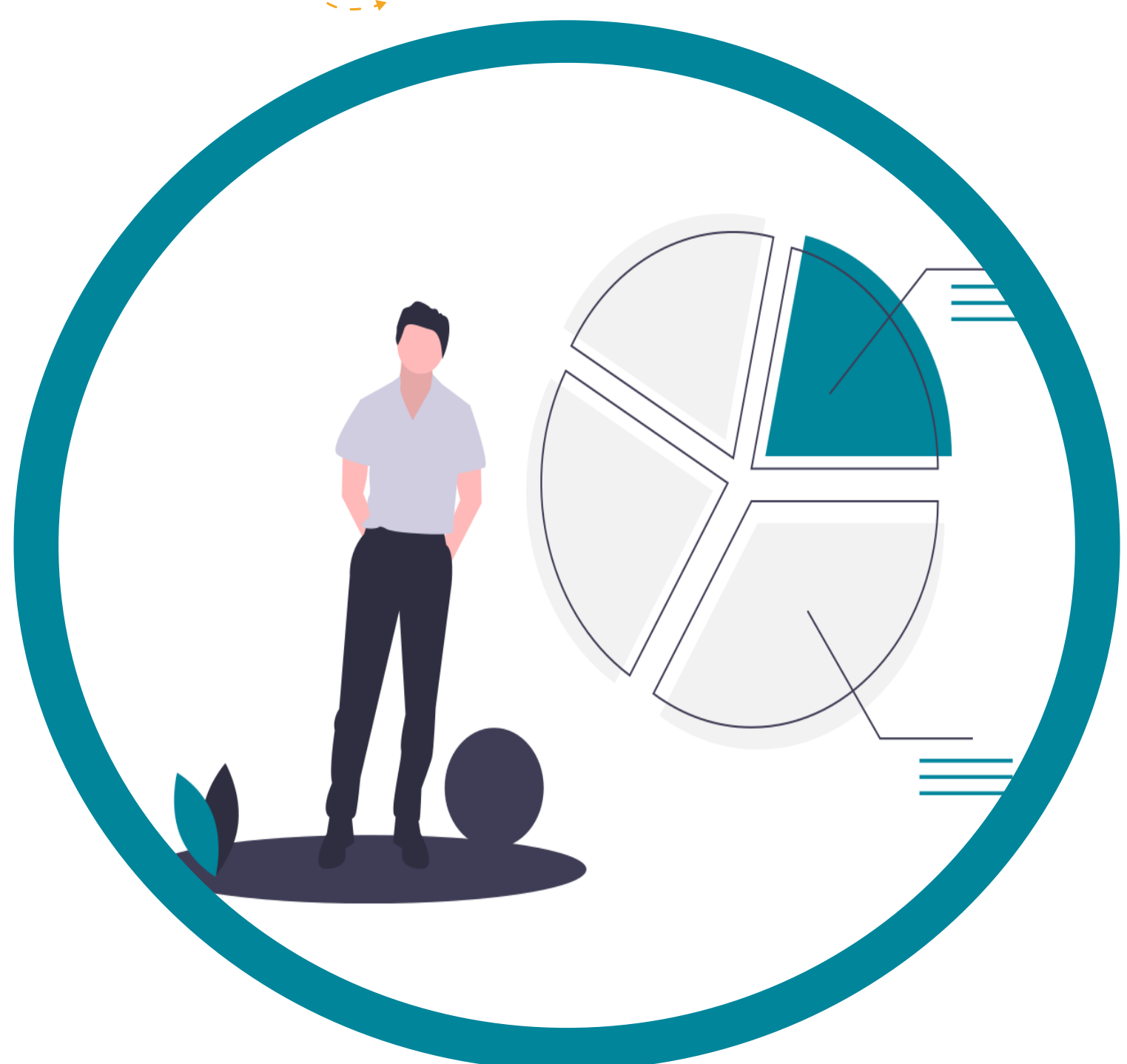
vienošanās par tirgus sadali