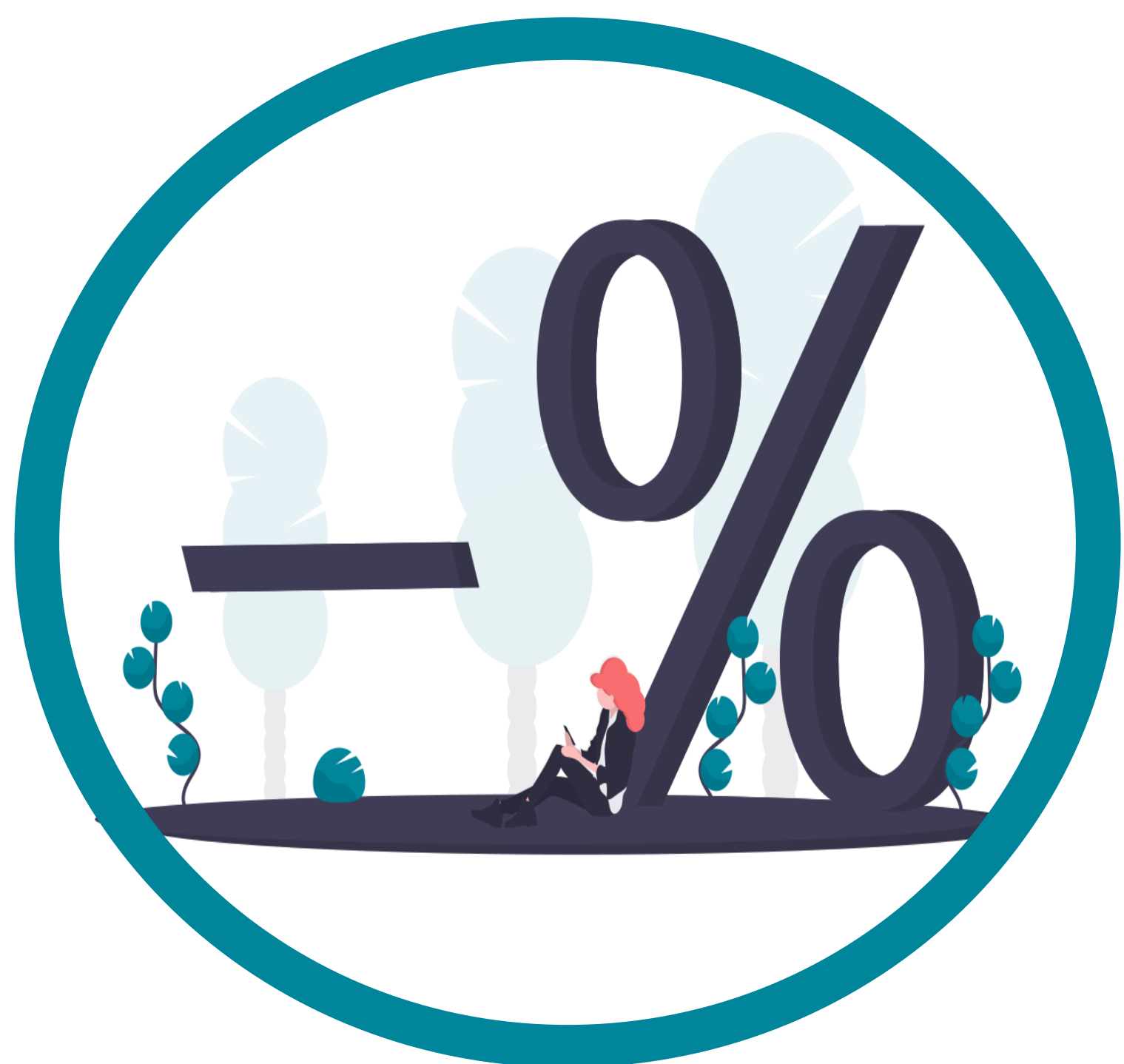
vienošanās par cenu

Uzturot pārlietu ciešas attiecības ar konkurentiem, uzņēmumam ir risks iesaistīties aizliegtā vienošanās jeb kartelī, kas ir smagākais konkurences tiesību pārkāpums. Ar šī saraksta palīdzību pārlicinies, vai Tava un uzņēmuma darbinieku ikdienas rīcība nepārkāpj likumu un uzņēmums nav kļuvis par karteļa dalībnieku.